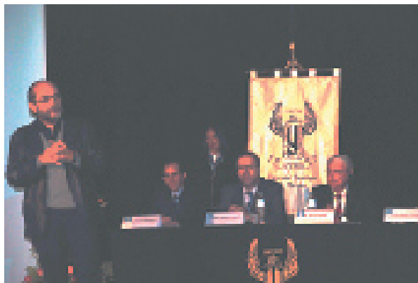
Presentación de la ARSEE y presidium