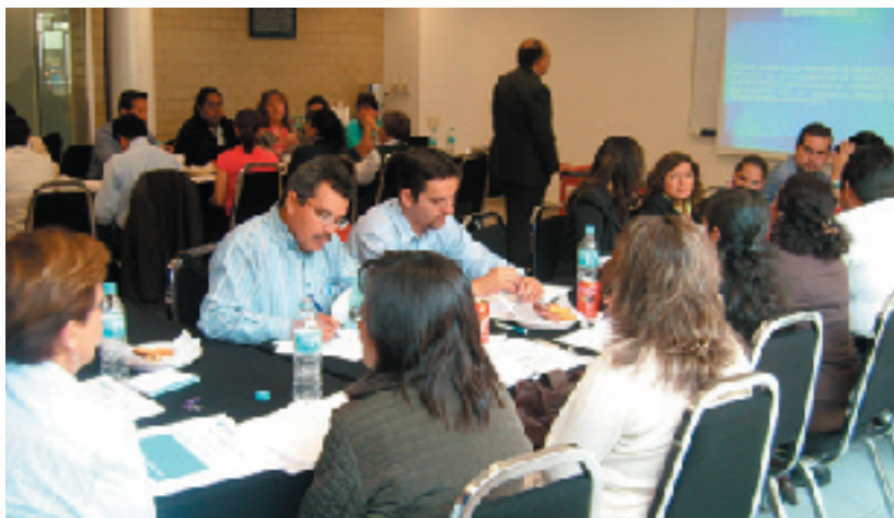
Participantes en el Taller de detección de documentación apócrifa.

Desarrollo Profesional un área fundamental en la misión de la ARSEE.