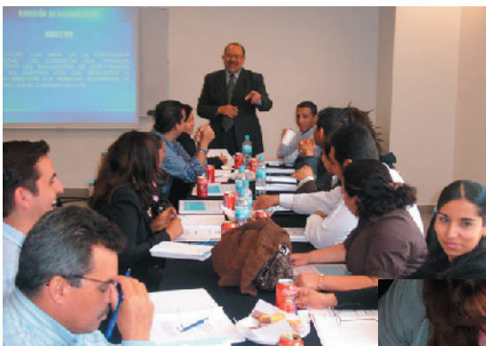
Participantes en los talleres llevados a cabo en el ITESO y en la UNITEC.

También en el mes de junio se tendrá el Taller de documentación apócrifa en la ciudad de México nuevamente debido al extraordinario nivel que registró la demanda en la fecha anterior y en la ciudad de Mérida.